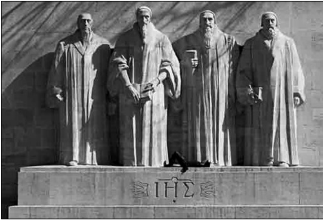
A reformáció genfi emlékművének központi szoborcsoportja (1917): Théodore de Bèze, Jean Calvin, Guillaume Farel, John Knox

mondta, feljegyzésre került, és most így nekünk, keresztényeknek van a világon a legfelkavaróbb evangéliumunk. Mert ki akarja megtagadni magát? Ki szeretné elveszíteni az életét?