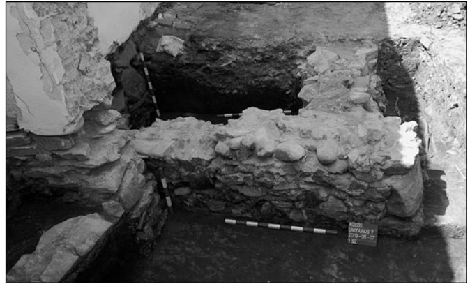
A középkori templom sekrestyéjének maradványai

Tudományos szempontból a legértékesebbek a templom északi fala közelében feltárt temetkezések. Ezeket a sírokat még a középkori templom első periódusa idején, valószínűleg a 14. század folyamán áshatták. Ezt onnan tudhatjuk, hogy a későbbi, 15. századi sekrestyét már ezen sírok fölé építették, a sekrestye északi fala részben ráépült az egyik temetkezésre. A templom belsejében, ahol rendszerint papokat és