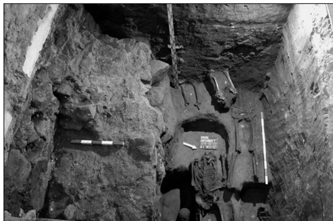
A középkori templom szentélyének alapozása és a templom belsejében feltárt sírok

Az épületet a 16. században jelentős mértékben átalakították: a régi, alig 5,5 méteres hosszúságú szentélyt teljesen lebontották és nagyobbat építettek a helyére, de a templom régi hajója ugyanakkor megmaradt. A 16. század végén vagy a 17. század első felében, amikor a kökös közönség nagy része áttért a protestáns hitre, a feleslegessé vált sekrestyét lebontották és egykori bejáratát befalazták.