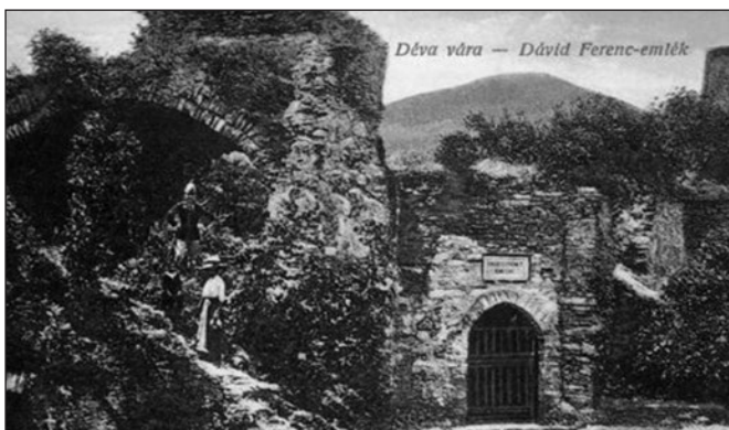
Dávid Ferenc emlékhelye 1916-ban

Hagyományörző huszárként, mint őrt álló a másik őrt állót, köszöntelek: erőt, tisztességet! Isten áldjon!