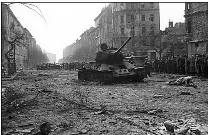
Szovjet tank Budapest utcáin