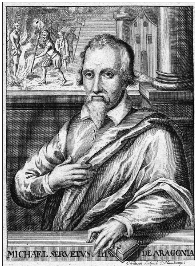
Christian Fritzsich (1695–1769) metszete

tosult Szervét Mihály alakját elevenítettük fel, októ-ber 31-én pedig a megalkuvás és képmutatás kapuit ledöntő reformációra emlékezünk. Nem hallgatha-tunk, és nem titkolhatjuk el a rég- és közelmúlt ese-ményeit; a jövő nemzedék lelkébe kell pecsételni a múltat.