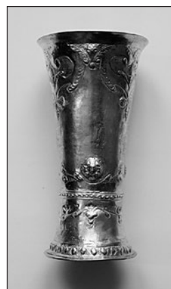
Úrvacsorai pohár felújítás előtt és után

– 2 Timóteus 4. rész, 2–5. versek: Hirdesd az igét, állj elő vele, akár alkalmas, akár alkalmatlan az idő, fedd, ints, biztass teljes türelemmel és tanítással. Mert lesz idő, amikor az egészséges tanítást nem viselik el, hanem saját kívánságaik szerint gyűjtenek maguknak tanítókat, mert viszket a fülük. Az igazságtól elfordítják a fülüket, de a mondákhoz odafordulnak. Te azonban légy józan mindenben, a bajokat szenvedd el, végezd az evangélista munkáját, töltsd be szolgálatodat.