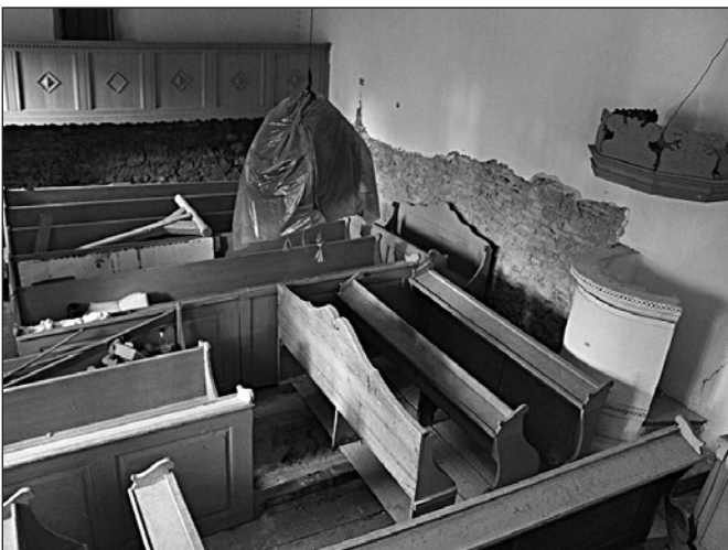
Felújítás előtti templombelső

A fentiekben címszerűen felsorolt munkálatok költségeihez – és működésünk anyagi alapjaihoz – sokan hozzájárultak az elmúlt években. A magyarországi állami támogatások több csatornán érkeztek: jubileumi kormánytámogatás (2018-ban), Egyházi és Nemzetiségi Kapcsolatokért Felelős Államtitkárság (2019), Bethlen Gábor Alapkezelő Zrt., Nemzeti