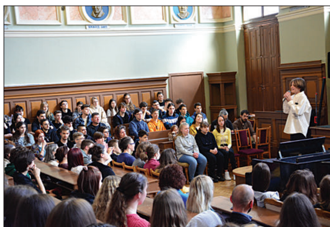
Ukrán népdalelőadás a János Zsigmond Unitárius Kollégium áhítatán