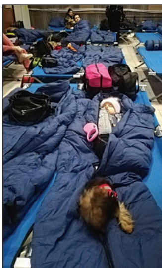
Menekültek a kolozsvári pályaudvaron