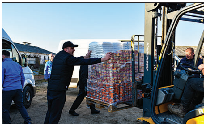
...és átadása Beregsurányban