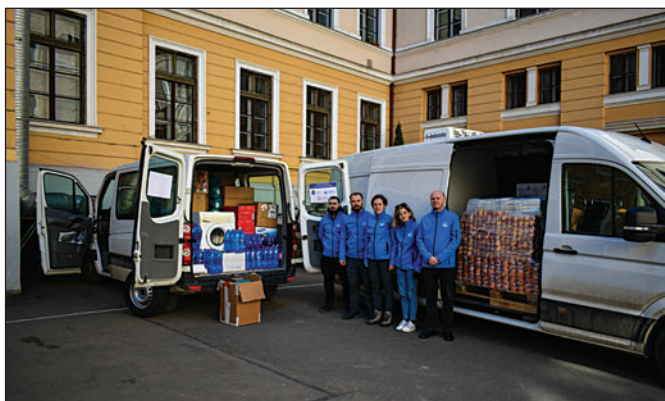
Az első segélyszállítmány útra kész Kárpátaljára...