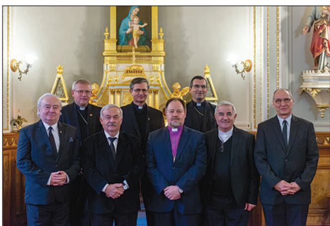
A magyar történelmi egyházak püspökeinek és segélyszervezeti vezetőinek tanácskozása Szatmárnémetiben