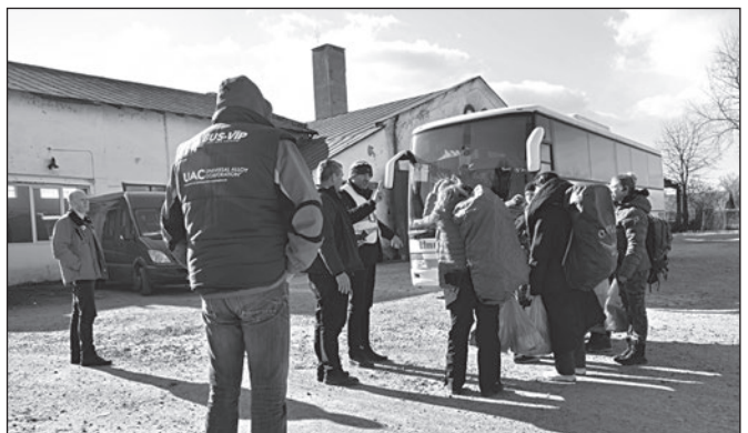
Menekültek továbbutazása Máramarosszigetről