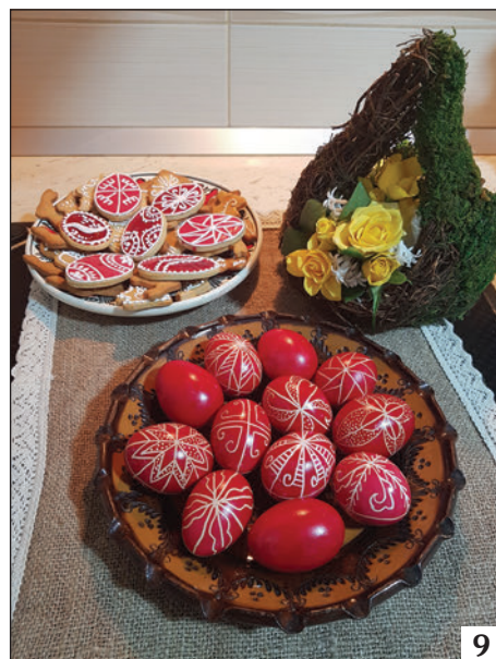
1–3: Alsófelsőszenmihály, 4: Medgyes, 5–6: Székelykeresztúr, 7–9: Küküllődombó