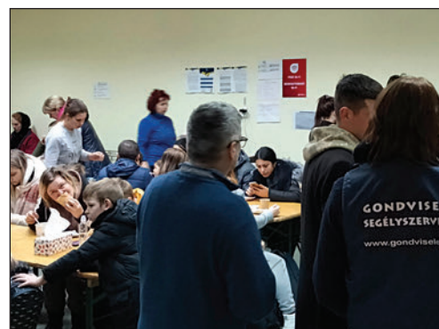
Meleg étel felszolgálása menekülteknek a kolozsvári pályaudvaron