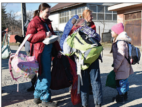
Ukrán menekültek a máramarosszigeti határnál továbbutazásra várva