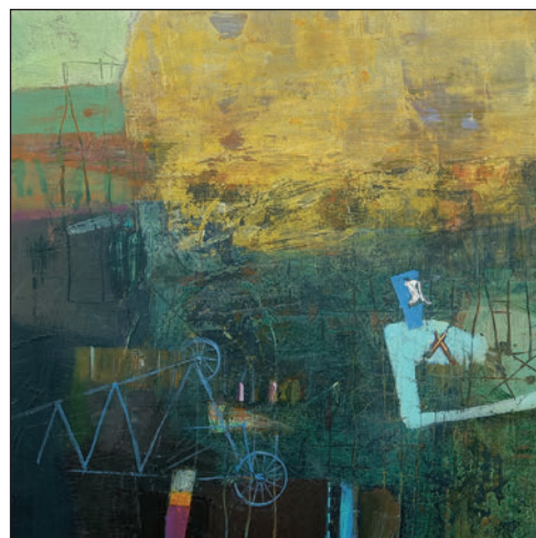
Perpetuum mobile III, 30 x 30 cm, akril, fatábla, 2022