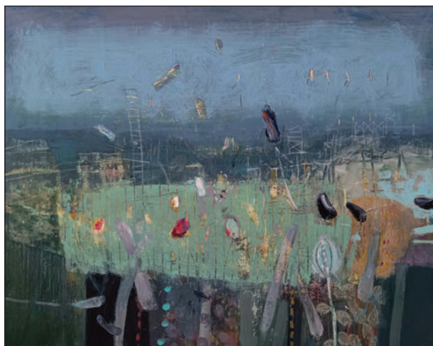
Vándorcirkusz III, 30 x 40 cm, akril, fatábla, 2021