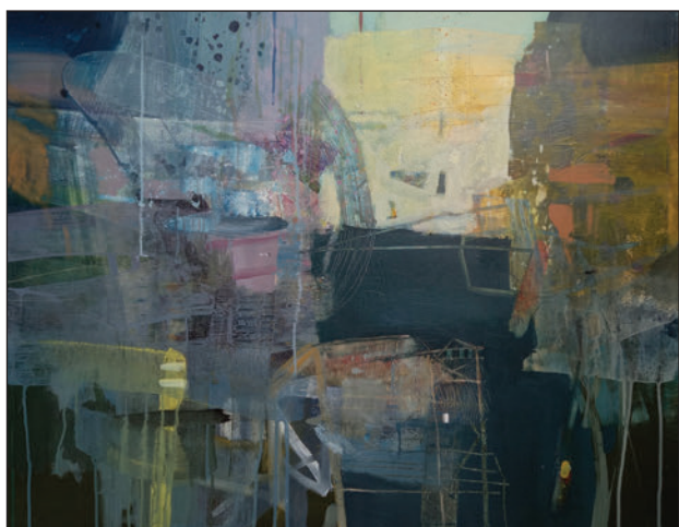
Fényben, 80 x 100 cm, akril, vászon, 2021