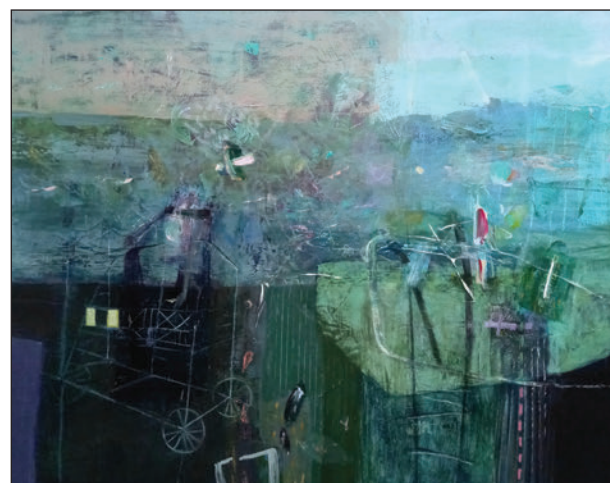
Perpetuum mobile I, 30 x 40 cm, akril, fatábla, 2021