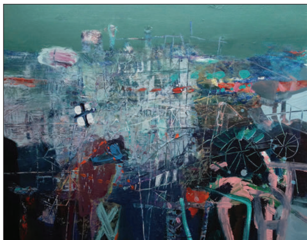
Vándorcirkusz IV, 30 x 40 cm, akril, fatábla, 2021