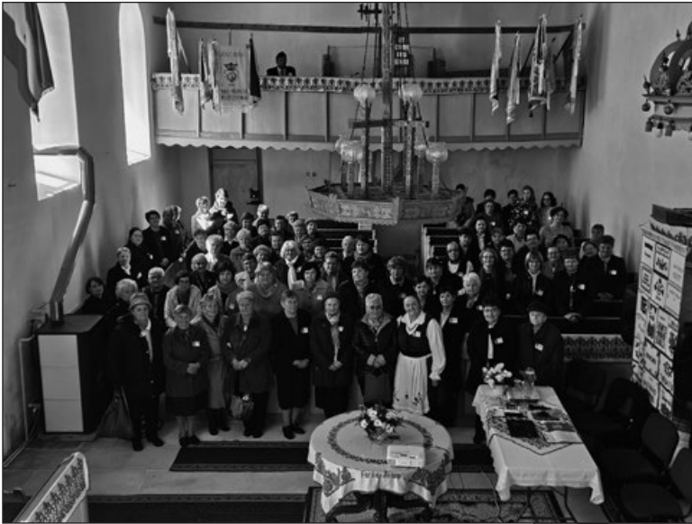
Az aranyosrákosi találkozó

Aranyosrákosen tizenhárom nőszövetségből hetvenöt nőtestvér vett részt a találkozón.