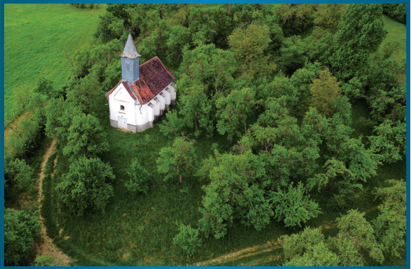
Az iszlói templom

KOLOZSVÁR, 1888–1948/1990. • 34. (94.) ÉVF. • 6. SZÁM • 2024. JÚNIUS • ÁRA: 4 LEJ