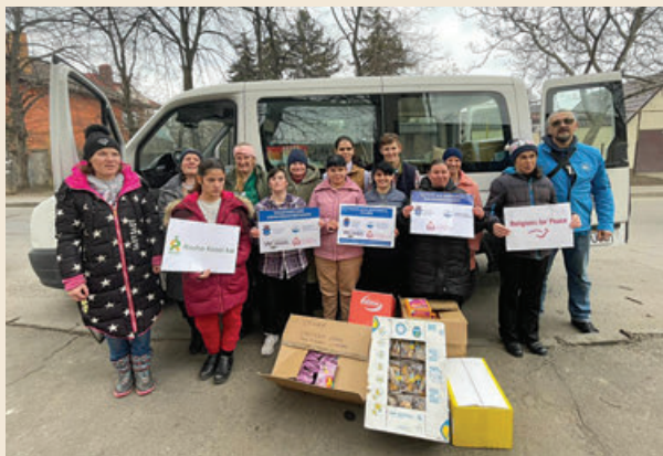
Segélyszállítmány átadása Odesszában 2024. március 8-án