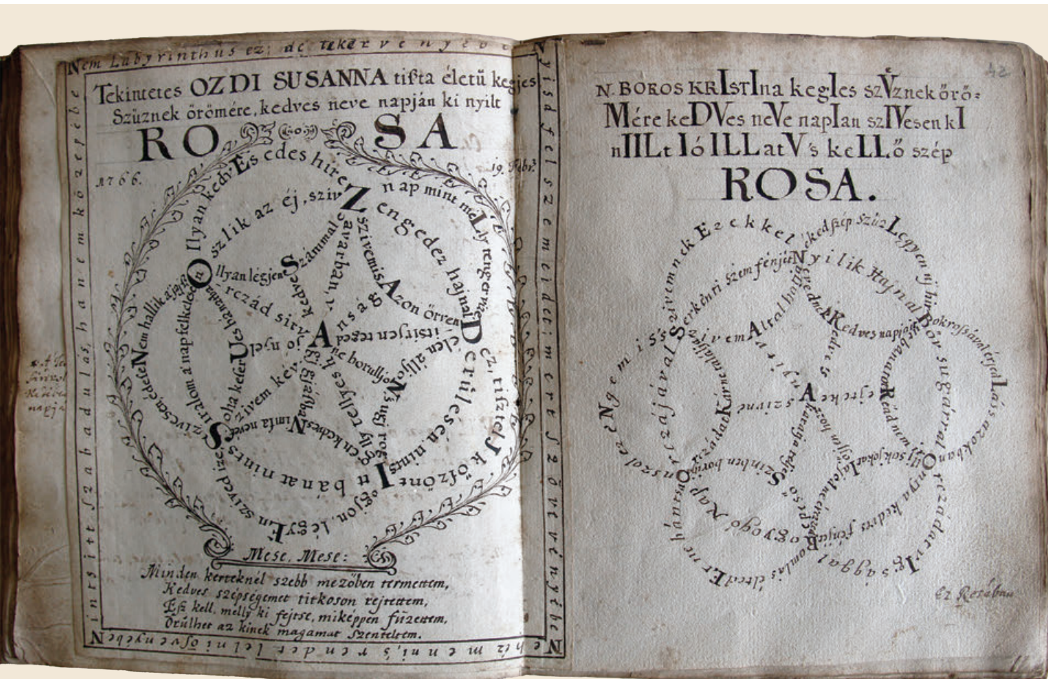
Id. Kozma Mihály képeversei | Molnár Lehel fotói