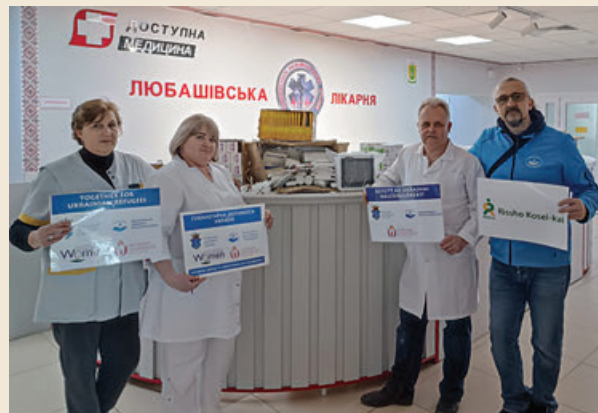
Segélyszállítmány átadása a ljubasivszkai kórházban (Dél-Ukrajna) 2024. március 8-án