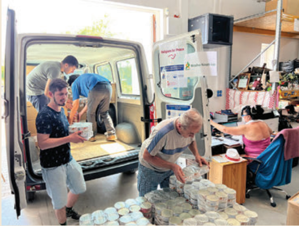
A tizenegyedik segélyszállítmány átadása Gelénesen 2024. július 16-án