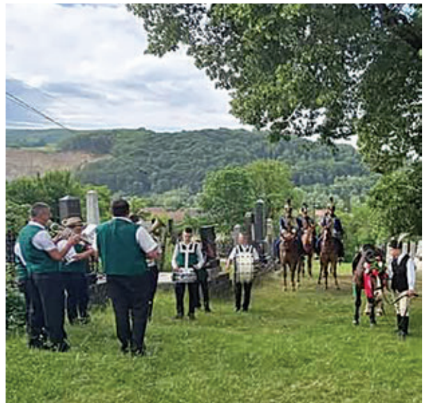
Kicsi pünkösöd Alsórákoson