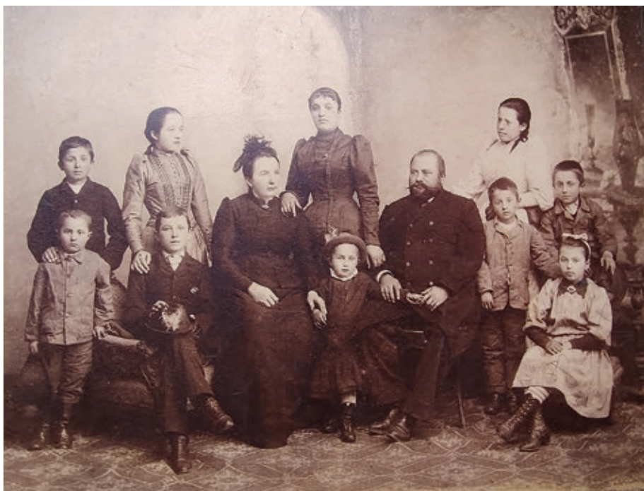
Családi fénykép 1892-ből

1905 júniusában a marosvásárhelyi kórházba kerül, szemhályoggal műtik sikeresen. A kórházban tüdőgyulladást kap, amibe néhány nap múltán belehal. Június 7-én Kelemen Albert esperes imája után Szabédra viszik, ahol június 9-én az unitárius templomban Fazakas Lajos nyárádszentmártoni unitárius lelkész tart egyházi beszédet felette (Jn 17,4–5): „Én dicsőítettelek téged e földön: elvégeztem a munkát, amelyet reám bíztál, hogy végezzem azt. És most te dicsóíts meg engem, Atyám, te magadnál azzal a dicsőséggel, amelylyel bírtam te nálad a világ létele előtt.” Emléke legyen áldott!