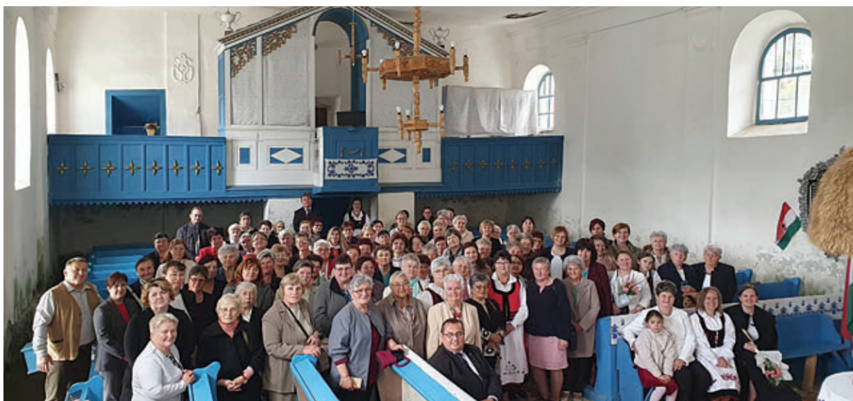
Fent az alsófelsősztmihályi, lent a ravai találkozó