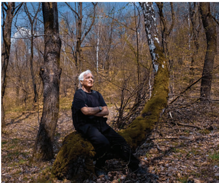
| Fotó: Márkos Tamás

Mind a kettő nagyon izgalmas. Amikor elvégeztem az akadémiát, és bekerültem a zenekarba, rájöttem, hogy egészen más mesterség együttesben játszani. Ott nem annyira szükséges a kiemelkedő technikai tudás, ami egy szólistától elvárható, ellenben olyan tulajdonságok