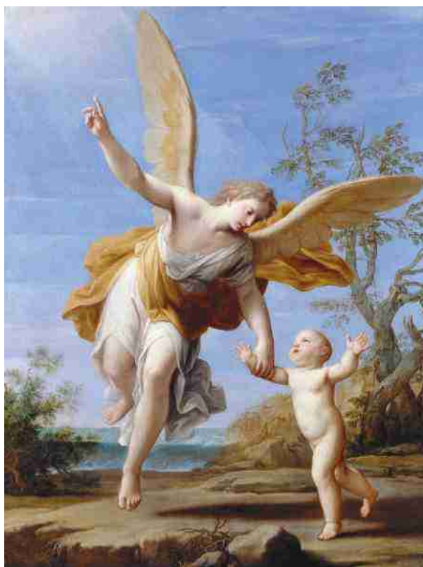
Marcantonio Franceschini: Órangyal (1717)

írott másolat járt) az angyal szót négy értelemben használja. Így nevezi sokszor a Biblia a lelketlen jelenségeket és dolgokat, amelyeket Isten saját akarata szerint alkalmaz. Ugyanígy hívták a prófétákat és rendkívüli tanítókat, akiket Isten sajátos feladatokkal bízott meg, de angyalnak neveznek mindenféle követet és szolgát, aki valamilyen úr nevében jár el. Végül pedig ugyanígy neveztetnek az „...értelemmel és okossággal bíró lelkek, kik az embereknél erejükre, tehetségükre és szentségükre nézve nagyobbak, akik által az Isten, mint eszközökkel él a maga akaratának végrehajtásában”. E negyedik értelemben vett létük – Csíkfalvi szerint – a „józanokossággal” teljesen megegyező bizonyosság a következő okok miatt: amint léteznek lélek nélküli testek, úgy létezniük kell test nélküli lelkeknek is. Ahogy léteznek e világon az embernél alacsonyabb rendű lények, úgy létezniük kell tökéletesebbeknek is. Szerfelett korlátozná az Isten mindenhatóságát, ha a legmagasabb rendű lény, akit teremtett, az az ember volna. Továbbá pedig a „természetvizsgálók” egyik alapszabályára hívja fel a figyelmet, miszerint a világban nem léteznek ugrások. Az élettelenek és az élőlények rendszere rangsorban áll, legmagasabb szintje az ember, de semmi okunk nincs azt feltételezni