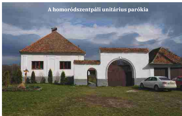
A homoródszentpáli unitárius parókia

De igen. Javítsunk, tartsuk karban! Úgy, ahogy eleink tették, csak a legszükségesebbet. Csak természetesen. Teljes tetőfelületeket ki kell új cserépre cserélni? Általában nem.