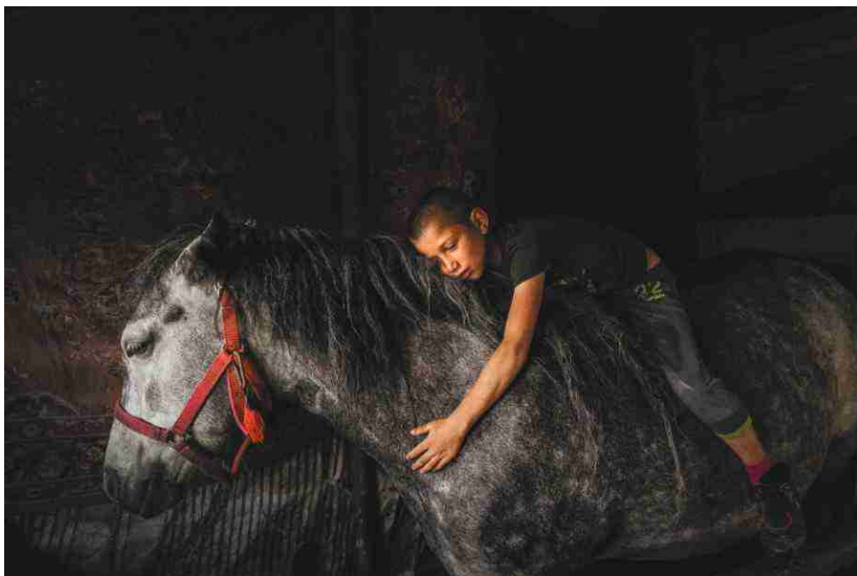
Tűzpróba, Csiksomlyó – 1

örökítem meg, amit látok, hanem a bensőmmel fotózom – az érzelmeim és az érzéseim által vezérelve, ahogy zenélni is szeretek. A másik fontos dolog számomra az együttműködés. Az utcán járva gyakran előfordul, hogy valaki vagy valami felkelti az érdeklődésemet, bevonz, és akkor elkezdem körbejárni a témát. Sokszor ez oda vezet, hogy kapcsolatba lépünk, beszélgetni kezdünk. Előfordul, hogy valaki megosztja velem az élettörténetét is. Egy-egy ilyen találkozásból akár nagyobb lélegzetű közös munka is kialakulhat. A fényképezés számomra olyan, mint egy útlevel: lehetőséget ad arra, hogy közelebb kerüljek ismeretlenekhez, megismerjek emberi sorsokat, betekintsek az életükbe – ezek a találkozások az én lelki világomat is gazdagítják. Általában úgy indulok el otthonról, hogy „csak” elmegyek kicsit fotózni, és közben fogalmam sincs, mi lesz belőle. Aztán három-négy – vagy akár még több – hasonló beszélgetés élményével térek haza.