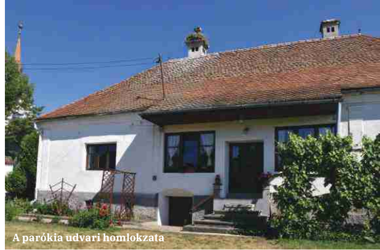
A parókia udvari homlokzata

nemzeti értékrendben gondolkodó közösségi vezetőnek ez utóbbi feladat pont olyan érthető kellene hogy legyen, mint a műszaki és gazdasági tartalom.