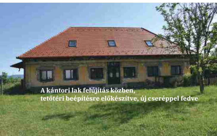
A kántori lak felújítás közben, tetőtéri beépítésre előkészítve, új cseréppel fedve

Kinek a felelőssége mindez? Természetesen a tulajdonos, a közösség felelőssége. Az unitárius egyháznak kell vigyáznia saját épületeit, az önkormányzatnak is a sajátját, hiszen mindkét intézmény a közösség tagjainak tartozik elszámolással. Elszámolással azért is, ha egy épület beázik és megromlik, de elszámolással akkor is, ha az történeti értékrétegeit veszti el, észrevétlenül... Lehet, hogy ez utóbbi fogalomkör elvontabb, absztraktabb, a közösségi vezetők számára nehezebben értelmezhető. Az érthető, hogy cserépre áldozni kell, az is, hogy műszakilag újat kell venni, de az már nem érthető, hogy arra is érdemes áldozni, hogy megőrizzük történelmünk, örökségünk látható évgyűrűit. Nem érthető, hogy a helyi közösség manufakturális jellegű cserepe talán többet ér, mint az import gyári, mert helyi munkaerőt foglalkoztat, helyi hagyomány tart életben? Azt gondolom, hogy