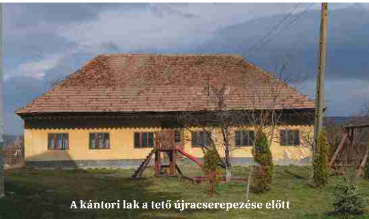
A kántori lak a tető újracserépezése előtt

Eleink leggyakrabban átrakták a cserepeket, felhasználva azt, ami még jó, lecserélve azt, ami elavult. Egyszerre sosem megy tönkre minden cserép, csak egy része. Mivel egészítették ki? Hasonló méretű, hasonló technológiával készült cseréppel: helyivel, kézi vetésűvel. Nyilván, mert akkor nem volt más. Az eredmény – technikailag javult állapot, de vizuális folytonosság. A befektetés mértéke, ára – sokkal kevesebb, mint egy teljesen új tető kifizetése.