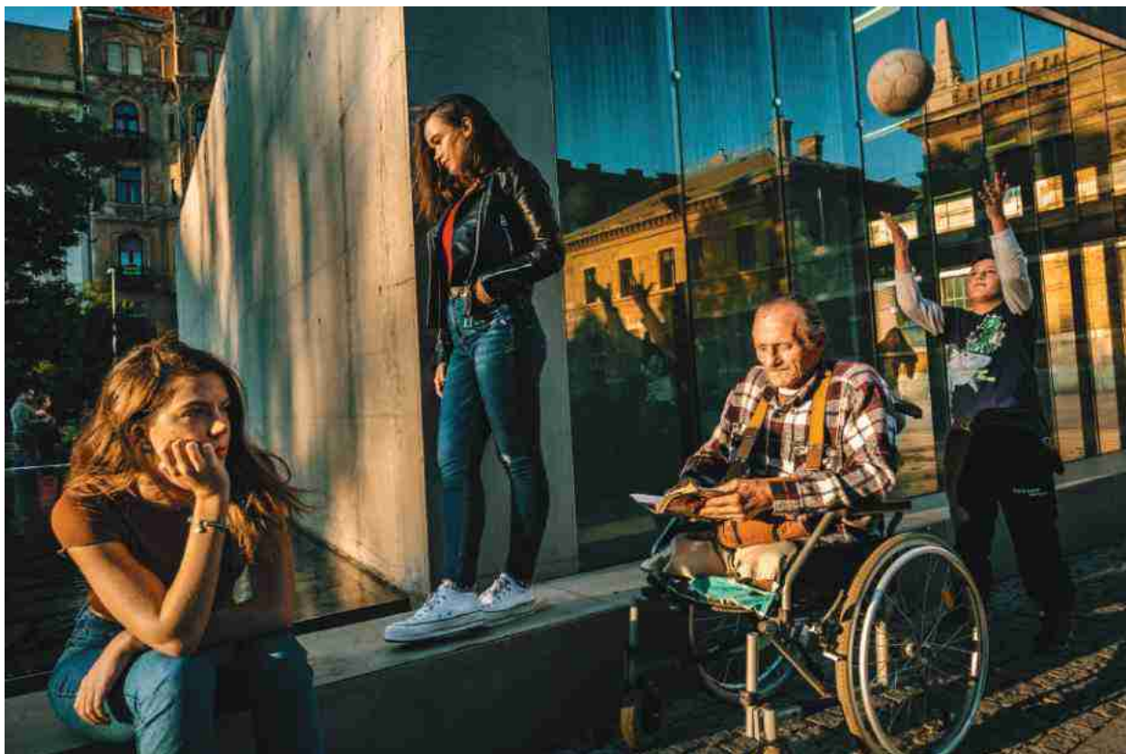
Budapest, VIII. kerület – 1

Természetesen egy idő után, ahogy kezd kikristályosodni a téma, leszűkül a spontaneitás tere. Számomra az a több kihívást jelentő fázis, amikor már túl vagyok a fotózás folyamatán, és rendszerezni, összeválogatni kell az anyagot. Úgy érzem, az én erősségem az, hogy nem azt