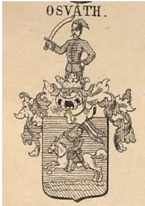
Az O'SVÁTH család címere.

SIEBMACHER, Johann: Grosses und allgemeines Wappenbuch in einer neuen, vollständig geordneten und reich vermehrten Auflage mit heraldischen und historisch-genealogischen Erläuterungen. 468.p. + 343.tábla. [Nagy és általános címerkönyv egy új, teljesen rendezett, heraldikus és történeti-genealógiai magyarázattal gyarapított kiadásban.] IV.köt. (Der Adel von Ungarn. [Magyarország nemessége.]) Nürnberg, 1893 15 , Verlag von Bauer und Raspe. 468 p.