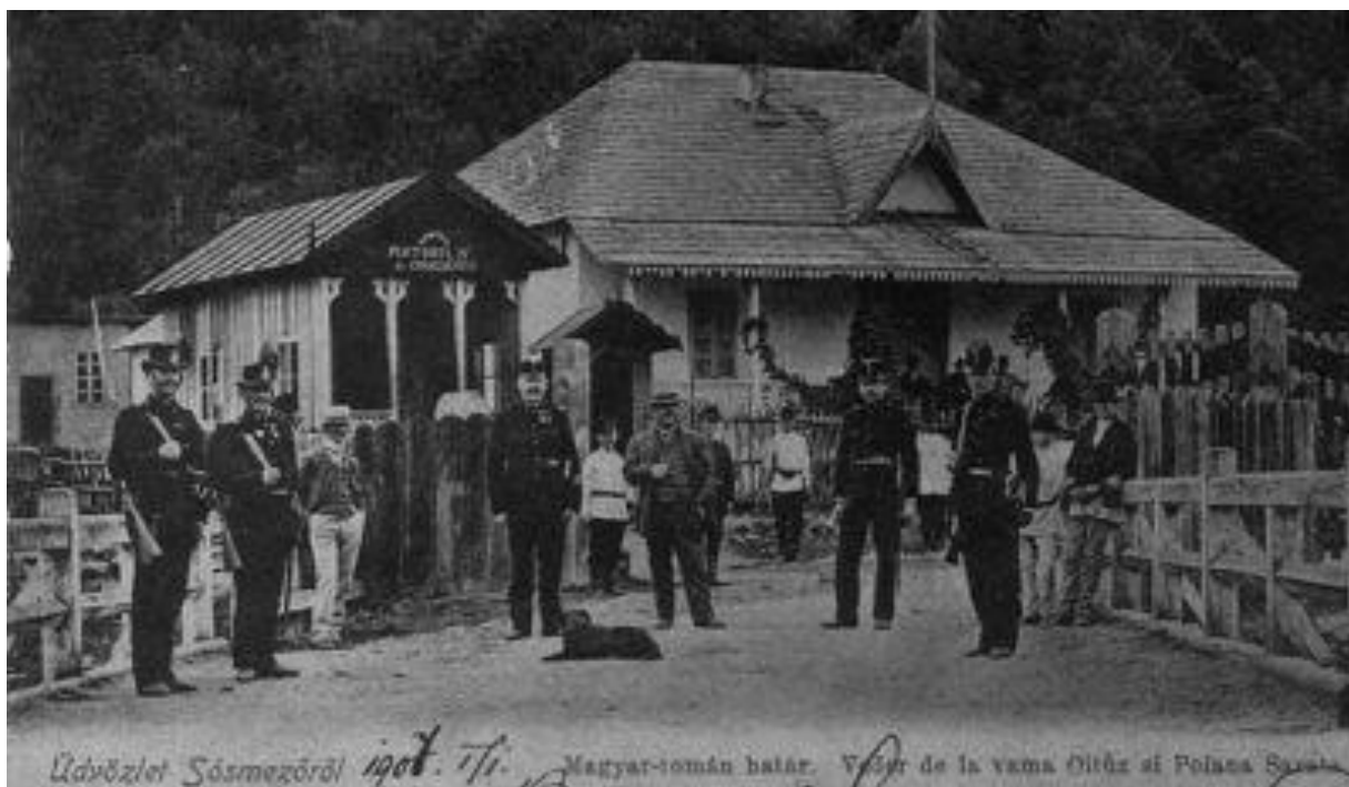
Az Ojtozi-szoros határátkelőhelyénél elfogott határsértők 1886-ban.