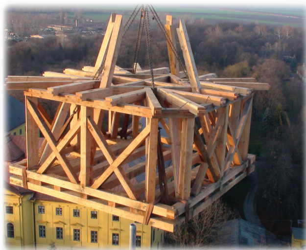
Kalocsai székesegyház toronyszerkezete