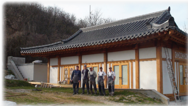
Búbánatvölgy koreai zen templom

nyugati ember is képes elkészíteni egy ilyen bonyolult szerkezetet. Ezért a különleges munkáért a szakma egy kategórián kívüli különdíjjal jutalmazta.