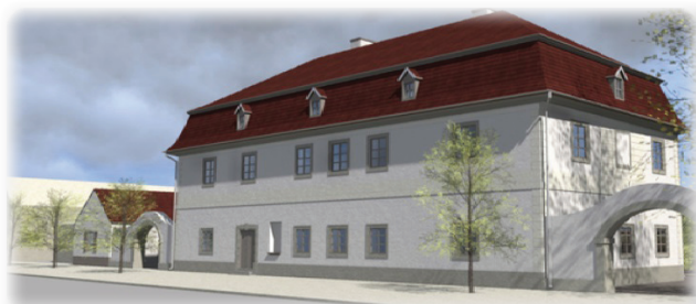
Zirci „Bagolyvár” Fogadó