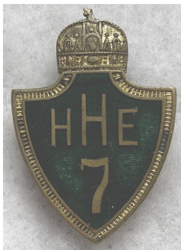
A 7. honvéd huszárezred sapkajelvénye

Felesége, Basovszki Apollónia 1887-ben született. Gyermekük: Mária (1906. augusztus 15-22.), Ferenc (1907. augusztus 21. – 1909. március 10.), Ilona (1910. január 14. – 1915. december 03.), Apollónia (1912. december 1.), Rozina (1915. augusztus 3.), Pál (?).