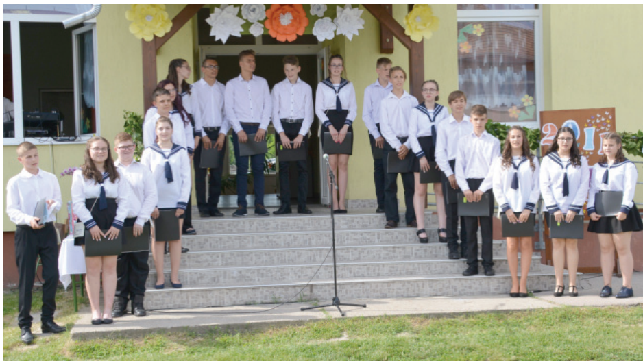
A 8. osztályosok a Miénk a grund című dallal búcsúztak iskolájuktól

Megtisztelő volt számunkra, hogy ezt a jeles évfordulót velünk szeretnék volna megünnepelni. Valószínű, hogy olyan útravalót kaptak egykori tanáraiktól és szüleiktől, ami visszavezette őket ide. Kívánom, hogy további életük teljen egészségben, nyugalomban, és szeretetben.