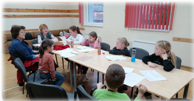
Folynak a bábcsoport próbái

Bűvös Bábos Fesztivált, azaz az amatőr gyermek bábjátzás négy napos ünnepét rendezi Veszprémben május 11-14. között a Nemzeti Művelődési Intézet. Minden megye és magyarlakta terület legjobb gyermekbábcsoportja érkezik Veszprémbe és mutatkozik be, hol klasszikus bábszínházi, hol pedig rendhagyó helyszíneken, teljes előadásokkal és rövid flashmobokkal egyaránt. A fesztiválra Sárisáp meghívást kapott. Az Aranykulcsocska Bábcsoport a Buta kisegér című darabbal készül a rendezvényre. A fellépésen túl a gyerekeket színes programok szórakoztatják majd a hétvége alatt, amely Bábos Parádéval ér véget, amelyen profi bábelőadások, bábkészítő foglalkozások fogadják nem csak az ifjú bábosokat, hanem minden veszprémi családot.