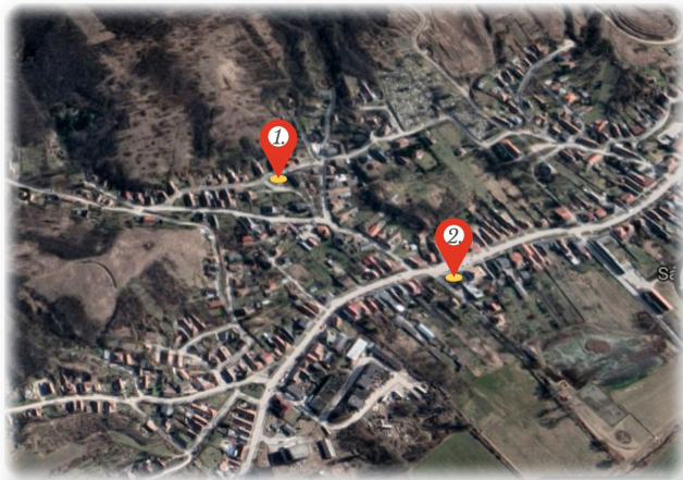
1) a család házának helye, 2) az akkori községháza helye

A család háza a mai Petőfi Sándor utca és Kossuth Lajos utca közötti területen állt. Ez ma beépítetlen terület. A tágabb család is a közelben, a Csaposkút környékén lakott. Amikor egymást látogatták, a nők és gyerekek féltek hazafelé a sötétben.