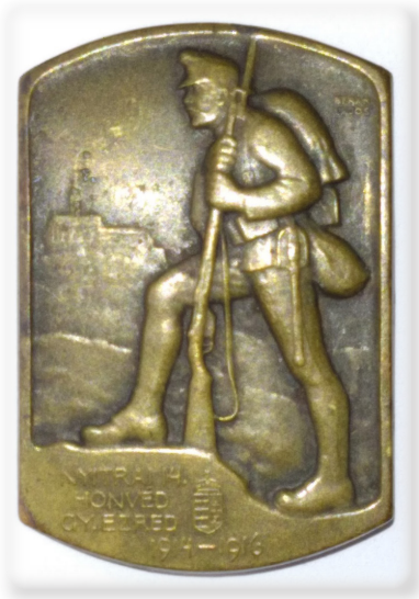
A nyitrai 14. honvéd gyalogezred sapkajelvénye 1916-ból. Anyaga sárgaréz. Tervezte Berán Lajos szobrász, éremművész, az Állami Pénzverde későbbi fővénsnöke. Csicsmann János gyűjteményéből.

A sorozottak a községháza előtt kellett gyülekezzenek. Elindult, hogy pontosan odaérjen a nem messze lévő gyülekezőre. Adategyeztetéskor kiderült, otthon felejtette a behívóparancsot és személyes iratait. Lóhalálában futotta le a párszáz métert hazáig. Amikor betoppant, kitért a jajgatás és zokogás a nőkből. Tudni vélték, hogy visszafordulása balszerencsét hoz majd fejére.