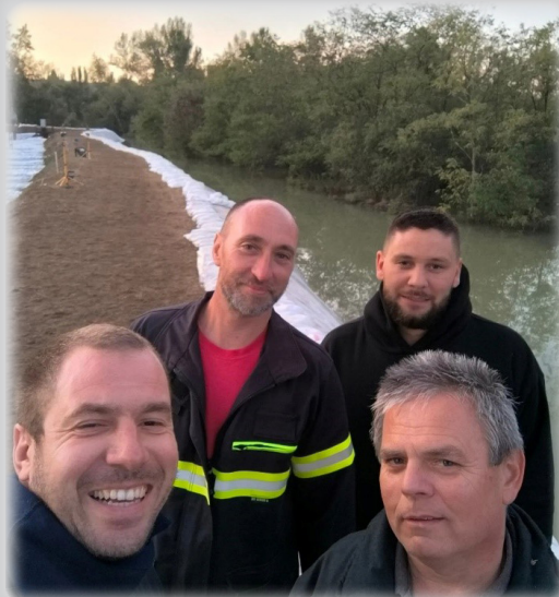
A képen a pilismaróti védekezés, az éjszakai műszak után a napfelkelte látható.

ANNAVÖLGY ÉS SÁRISÁP KERTBARÁTAINK ÉS BORBARÁTNŐINEK EGYESÜLETE SZERVEZÉSÉBEN