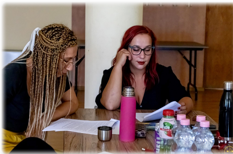
A „na. Mi na?” című darab olvasópróbája a Sárisápi Bányász Községi Tér oszlopos termében