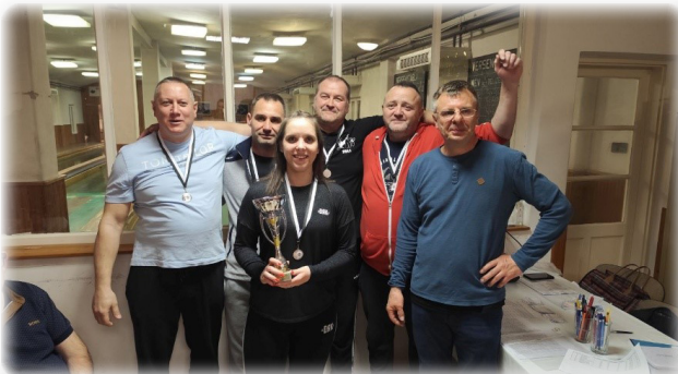
A második helyen végzett Góliátok csapata