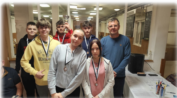
A bronzérmes Fenyőfák

A falubajnokság zárásaként páros bajnokságon is indulhattak a csapatok tagjai, a legjobb és legrosszabb dobásátlagot elérők párost alkotva léptek pályára vegyes, női és férfi kategóriában.