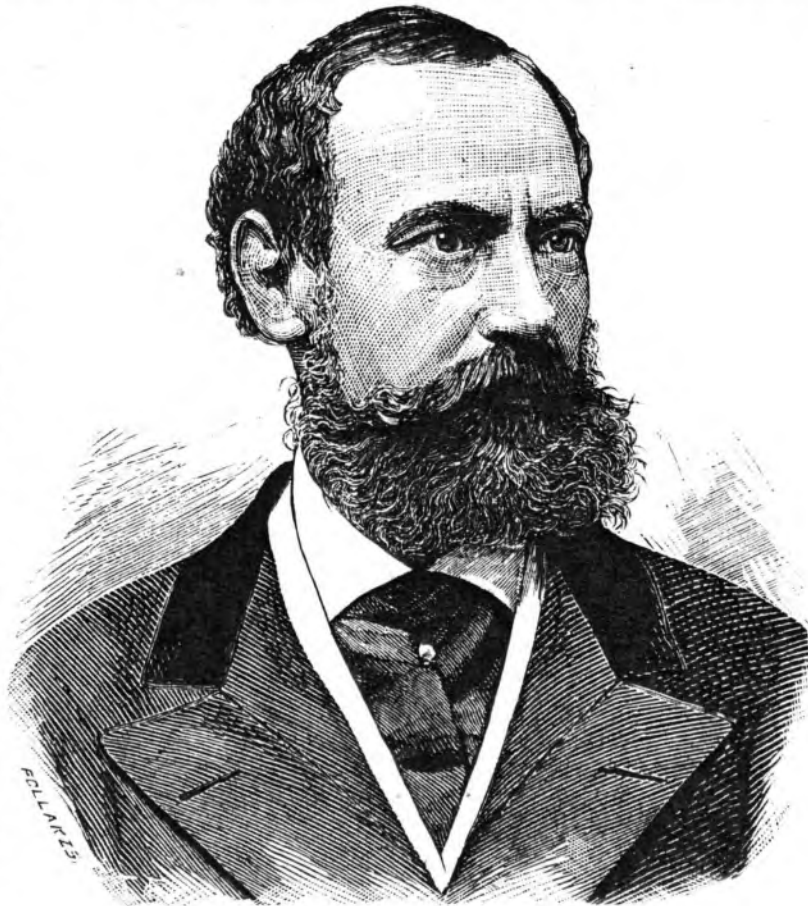
TISZA LAJOS GRÓF.

a város szabályozására szükséges lejtmezés és talajfurások következtek. Az 1879/80. téli időszak az ujjaépítés programjának megalkotása volt. Elkészült az új rendezési térkép, mely Szegedet nagy várossá tette. Eközben a könyöradományok szétosztásának óriási feladatát is megoldotta; maradandó érdeme Szeged háztartásá-