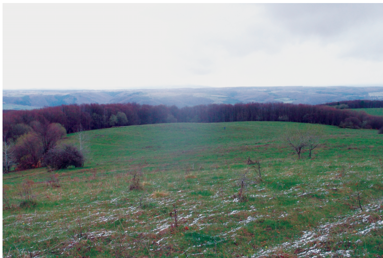
5. ábra. A Felső-tető a Keselyű-tetőről nézve.