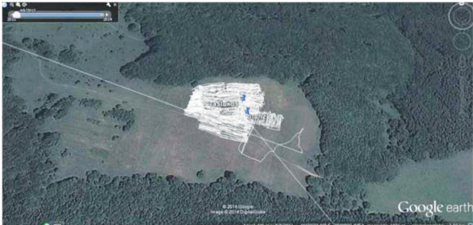
7. ábra. A Google Earth térképére vetített tracklog. Bacskai: i. m.