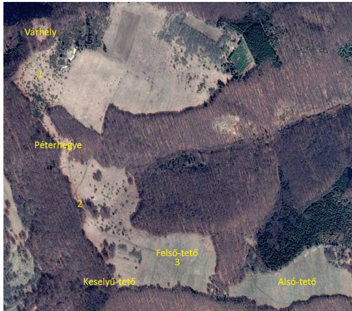
2. ábra. A Firtos fennsíkja a Google Earth térképén.

Az aranyérmek közelebbi lelőhelye az elsődleges források szerint: 1. A várhely előtti lapos térség; 2. A Péterhegye és a Keselyű-tető közötti pont; 3. A Felső-tető