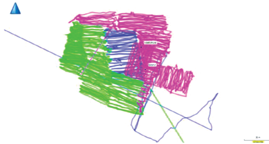
6. ábra. A Felső-tetőn kutatott terület tracklog térképe. Kék: első nap; zöld: második nap; bíbor: harmadik nap. Bacskai: i. m.