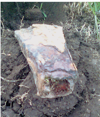
8. ábra. A vas tokosbalta, amely az 1857-ben Szász Károly által bírt kelta ezüstéremmel (Müller: i. m. Die Ruinen... 259.) és az 1959-es szondázás során talált két cseréptöréddel (Horedt–Székely–Molnár: i. m. 689. 5/24–25. ábra) együtt egy késő vas-kori kelta lelőhelyet jelez a Felső-tetőn