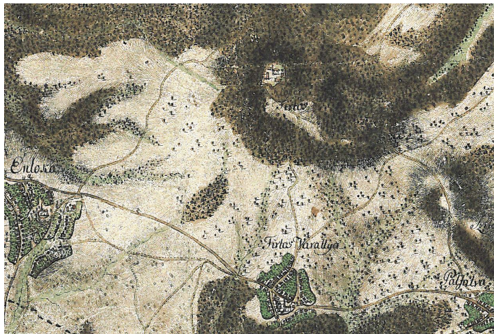
3. ábra. A Firtos és környéke az első katonai felmérés (1769–1773) 160. szelvényén

Az aranyérmek közelebbi lelőhelye az elsődleges források szerint: 1. A várhely előtti lapos térség; 2. A Péterhegye és a Keselyű-tető közötti pont; 3. A Felső-tető