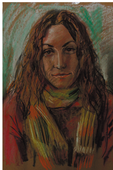
Balázs József alkotása