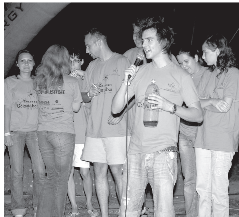
A gólyavetélkedőknek nagy szerepük volt az ismerkedésben

A harmadik nap valamivel lazább programokat nyújtott. Vetélkedő indult, melyben a cél az volt, hogy a csapatok minél szebb zászlót készítsenek, később fociban mérhették össze tudásukat: lányok és fiúk egyaránt szerepeltek, s közben pom-pom-lányok szurkoltak a kedvenc csapatuknak.