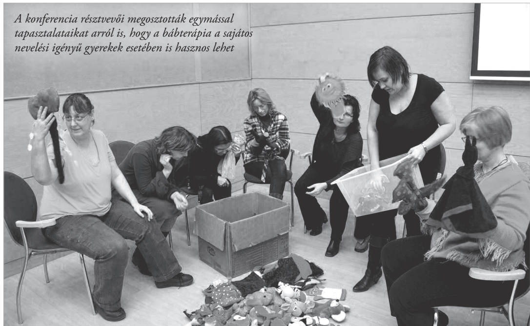
A konferencia résztvevői megosztották egymással tapasztalataikat arról is, hogy a bábterápia a sajátos nevelési igényű gyerekek esetében is hasznos lehet

Február 2-án a sajátos nevelési igényű gyerekek integrált nevelésének, fejlesztésének új pedagógiai-módszertani lehetőségeiről értekeztek a Kölcsey Központban a szakemberek. Főbb témakörök voltak: az autizmus, a bábterápia, a számítógép a speciális nevelési igényű (SNI) gyerekek fejlesztésében, a Down-szindrómás gyerekek fejlesztése. Másnap pedig a halmozottan hátrányos helyzetű és sajátos nevelési igényű gyerekek integrált nevelésének, oktatásának új módszereiről esett szó az alábbi területek mentén: info-kommunikációs technológia (IKT) eszközök az integráció szolgálatában, befogadó intézmények, a művészeti nevelés szerepe a halmozottan hátrányos és a sajátos nevelési igényű gyerekek fejlesztésében, határok és átmenetek.