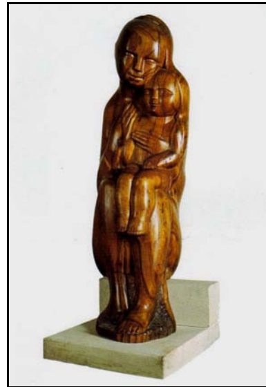
Venczel Árpád: ANYASÁG

miniatürizálás és ismétlés eszköztárával élve készítette el Bonchida 2000 című fotókompozícióját. Erdős Zsigmond Zsolt és Egyed Ufó Zoltán ötletes alkotásai egészítik ki a magának egyre nagyobb helyet követelő művészfotó kínálatot. Sőt, műfajként a video-art sem hiányzik a tárlatról.