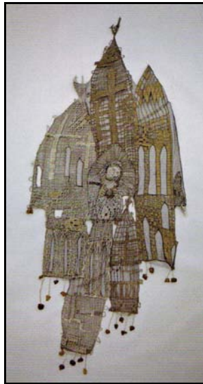
Novák Ildikó: TORNYOK