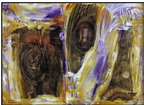
Tompos Opra Ágota: LÁRMAFÁK