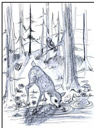
Péter Katalin illusztrációja

recseg az avar: halkan pettyes hátú őzike torpant meg a közelemben, vizet inna, de fél a sűrű százféle zajától.