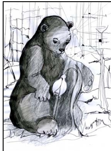
Péter Katalin illusztrációja

Fent a hegyen, napfényes tisztáson kis őzike lábnyomában kinyílt a hóvirág, zsenge szárán fehér szirmait megbillenti a szél, s mint egy apró csengettyű, kedvesen, finoman ébresztőt csilingel az erdő szélén.