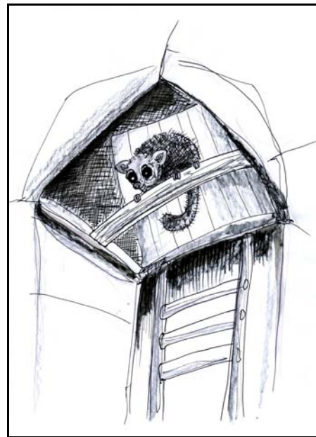
Péter Katalin illusztrációja

Nem félt egyáltalán, el se szaladt, bizony örült a találkozásnak, mert ő is nagyon kíváncsi volt — már mióta —, ki lakik még itt a havasi házban.