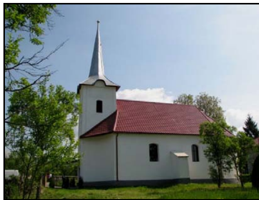
A kackói templom a felújítás után

Az 1934-ben, az EMÍR kiadásában megjelent Szentségvívők című dokumentum- és kulcsregényében az 1920-as évek elején kibontakozó marosvásárhelyi és erdélyi irodalmi élet megszületésének hiteles képét adja Berde Mária.