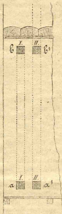
1. Ábra. Szobaszellőztető berendezés.

E szellőztető készülék 1886-ban lett alkalmazva s mint az eddigi tapasztalat igazolta, kitűnően működött. A szobában folytonosan kellemes ozontartalmu levegő volt és a hőmérsék különbsége sem volt oly jelentékeny, mert összehasonlítva kísérletek útján igazoltatott, hogy szemben az oly szobával, melyben ezen szellőztető készülék alkalmazva nem volt, a hőfok különbsége összesen csak 1 o -ot tett ki.