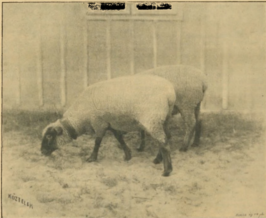
121. Ábra. Hasjuhok. Gróf Károlyi Lajos stomai tevérszéből.

Ezzel egyetemben természetesen az egész has is nagymértvben növekszik úgy, hogy a jobb oldal hasrésze is erősen kidomborodik. A baloldali horpasztj kemény rugalmas tapintatu és minél több gázokat tartalmaz a bendő, annál kevésbé nyomható az be. A takarmányfelvétel már kezdetűl fogva szűnnetel. Épp ezen jelenség teszi különösen a legelőmarháznál vagy juhnál figyelmessé a pásztot az állat bajára, mert ez különvalva a többiek-től, nem legel. Kezdetben a bélsár ürítése erőltette kis mennyiségben még történik, de mihamarabb egészen szűnnetel, daczára, hogy az erőlködés fokozódik; lábait a beteg hasa alá szedi vagy azokat szétterpeszti; hátát felpoposítja, farkát magasán tartja, nyakát előre kinyujtja, mi mellett a fülek felököl. Heilyből minden felluvódott állat nehezen loválható, sokszor csak nagy hájára lehet mozgásra bírni. A felluvódás fokozódásával a légzés gyorsabb és erőltetetté válik, mit a hasfalak erősebb mozgása áru el; az állatok féltékenységet áru nek el, folyton ide-oda tipnegek, a szemek köthártyái kivörösödnek, a tekintet meredt, a felületés vérekek kidagadnak, a fülek tövén, a nyakoldalán, a hónalj alatt és a horpasz-