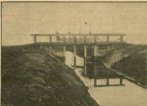
195. ábra. Rozvágyi álló.

* Békés-Csabáról Bécsbe egy szarvasmarhával megrakodott vagon szállítási díja 50 ft, hasonló nagyságú vagonba, a melybe 640 kg súlyú szarvasmarha fél, legjobb minőségű, 100 kg súlyú, 410 kg, súlyú, a melybe 1000 kg súlyú, 220 ft-ig, a szállítási díj azonban ugyanazon raliációban 49 forint kell fizetni, vagyis más szavakkal a szarvasmarhaszállítványát 100 kg értékvé súly kerül 100 ft-ba, a juhokszállításnál 220 ft-ba. A különbség tehát a birka hátránya 110 ft.