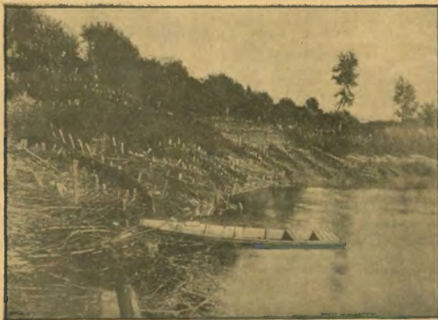
199. ábra. Csermelyi partvédekezést.

Az eredeti terv szerint a torókéri zsilip telt volna hivata az összes belvizek levezetésére. Miután azonban ez a zsilip másodpercenként csak 22,995 köbméter vizet hordt képes továbbítani, a lecsapolásra