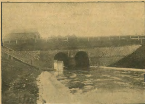
198. ábra. Karádi zsilip (mentett oldal).

A badragközi Tiszaszabályozás kezdetben nem számolt a belvizekkel. Meg volt győződve, hogy az árvizek betörésének megakadályozásával megszabadul a belvizektől is. Az első lecsapolási tervet ezéjla is az