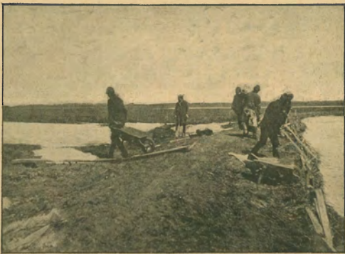
200. ábra. Védkezés.

Még kell még említenünk, hogy a brodorközi Tiszaszabályozás a lefolyt felzáró adattal, vagyis 1846-tól 1896-ig bezárólag összesen 5.522.879 ft 96 kr árba került a társulatnak. Ebből évtizedek szerint kimutatva, a társulat elköltött: