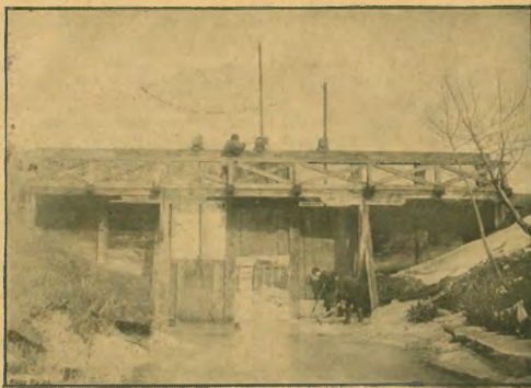
186. ábra. Kereszt ültő.

hogy az áru minőségére kifogás alá ne essék, mit többi közt azzal lehetne elérni, hogy a gyapjatermeszre nem alkalmas merinódiákat Dóvon kosokkal behágtatvának a keresztelési termékeknek mérszárzékli uton való értékesítésére.