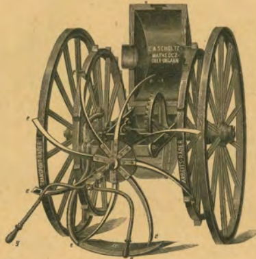
221. ábra. Scholtz-féle burgonyakiemelő-gép (hátsónézet.)

Ugyancsak a gép keretére van erősitve két csavar segélyével a gömbölyi vasból készült \lambda tartókar, mely az a szántóvas tartja. E kar tulajdonképpen kétkaru