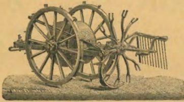
224. ábra. Clayton és Schulteworth „Hanson” nevű burgonyakiemelő gépe, (munkára felszerelve).

kültségek iránt ellentétlőbbak lesznek, mint a Scholtz-féle gép forgó karjai.