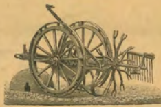
225. ábra. Clayton és Schulteworth „Hanson” nevű burgonyakiemelő-gépe (szállításra felszerelve).

A Carow-féle burgonyakiemelő-gép szintén ugyanazon elven készült mint az előbbi kettő, de ennél a szántóvaskiemelő-készüléken kívül még egy emelőszerkezet láthatunk — 225. ábra — mely arra szolgál, hogy a gép munkatésben is gyorsabban s könnyebben kiemelhető legyen, különösen a barázdák végén és a fordulósoknál. A gép vaskeretére van ágyazva a fogaskerékkel ellátott főtegelvény, melynek két végén a záró-külnesekkel ellátott bordázott talpu járókerekek láthatók. A kiszéső karok közös ágyba vannak beerősítve oly módon körülbelül, mint a Clayton & Schulteworth-féle gépnél