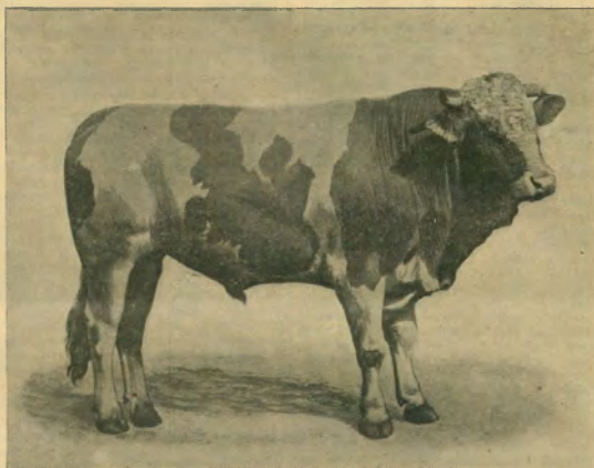
206. ábra. Benz I. 2 éves és 10/8 hónapos.

Egyenlő talajminőséget feltételezve a jó gazda 8–11 q-nyi ingadozások mellett 10 q-nyi átlagos gabonatermést ér el kat. holdanként,