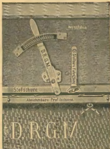
262. A „Westfalia” műtrágyaszóró-gép állító készüléke.

A vonóeszközök nem közvetlenül a szórószekrényen, hanem egy külön ezen célra készült és a szóró szekrényvel magával összekötöttben lévő előközsinalkalmazak, mi által a munkájukban esetleg bedőlő rendelkezéssé avagy akadály teljesen ki van zárva, a mennyiben a szórás egyenesen és egyenletesen történik. A gépet magát könnyen lehet tisztítani, mert ezt a gép egyszerű szerkezete, helyes összeállítása nagyon megkönnyíti. A műtrágyaszórógépek által szokott egy általánosnak nevezhető hiba előfordul, nevezetesen az, hogy a szekrény mentén végéig huzodó nyílás elzár. Itt azonban ez már eleve is ki van zárva, mert