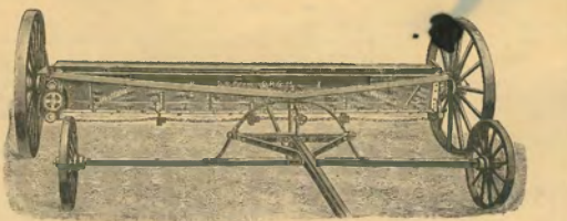
20. ábra. A „Westphalia” műtrágyaszóró-gép.

A 260. számú ábrán látható a „Westphalia” trágyaszóró-gép, mely nagyjában hasonlít vető-