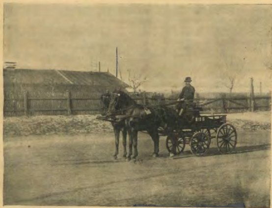
264. ábra. Korbuly István angol félvér kettős fogata.