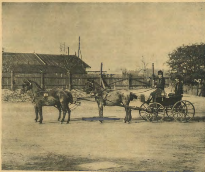
263. ábra. Jankovich Béán Elemér lipizzai négyes fogata.