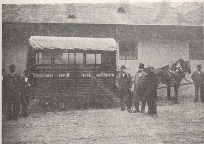
Az állatvédő egyesület állatmentő kocsija.

E modern berendezésű kocsit, melyet az itt lévő ábra tüntet fel, egy alkalmazottunk kezel nappal 4, éjjel 5 korona díjért, melyet a sérült állat tulajdonosa kell hogy lefizessen. A tulajdonos fizeti továbbá a két