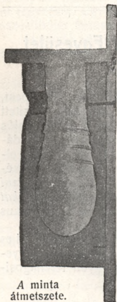
A minta átmetszete.

„Jókai“ könyvnyomda nyomása, Budapest VII., Thököly-ut 28. (Garay-bazár.)