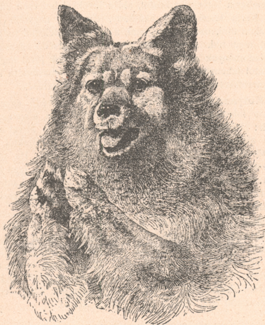
Méltányos ember irgalmas az ő állata iránt. Salamon: Példabeszédek könyve 12. 10.

A 102. és 103. oldalon a szövetség központjának járó folyóiratok vannak felsorolva. A külföldi folyóiratok közül első helyen az „Állatvédelem Budapest Hungary” szerepel. A külföldi folyóiratok összes száma 20. △