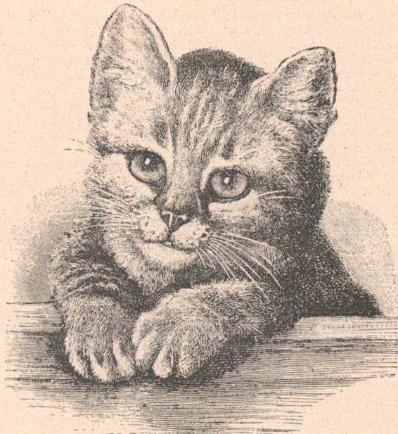
Ki szeret engem?

A Berliner Tierschutz-Verein minden állatvédelmi olvasókönyvének cím- és hátlapján e két kép van.