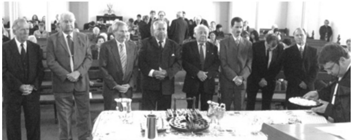
Presbíterek a Reformáció Emlékünnepén.