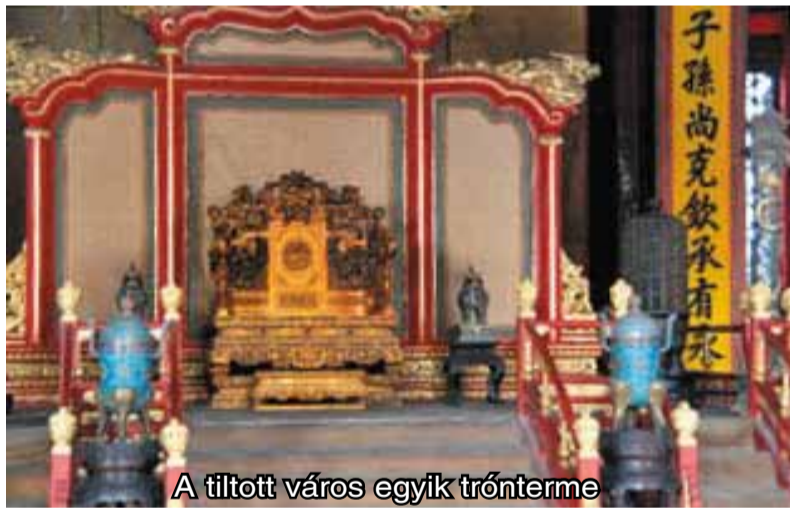
A tiltott város egyik trónterme

Mire csomagjainkat letettük a hotel-szobában, besötétedett, elindultunk éttermet keresni. A hotel körüli utcákon nagy tömeg ember között haladtunk. Az üzletek tele olcsó kínai árucikkkel. A buszból láttuk az elegáns drága márkás üzleteket, de nem gyalogoltunk vissza odáig. Az utcán mindenütt sok ember tolongott, ez Kínában minden városban így van. A hotel körül több étkezési lehetőség ajánlkozott, köztük McDonalds, KFC csirke étterem és Pizza Hut. Hallottuk, hogy Guangzhou Kína egyik leghíresebb gasztronómiai központja, inkább a hotel melletti kínai vendéglőt választottuk.