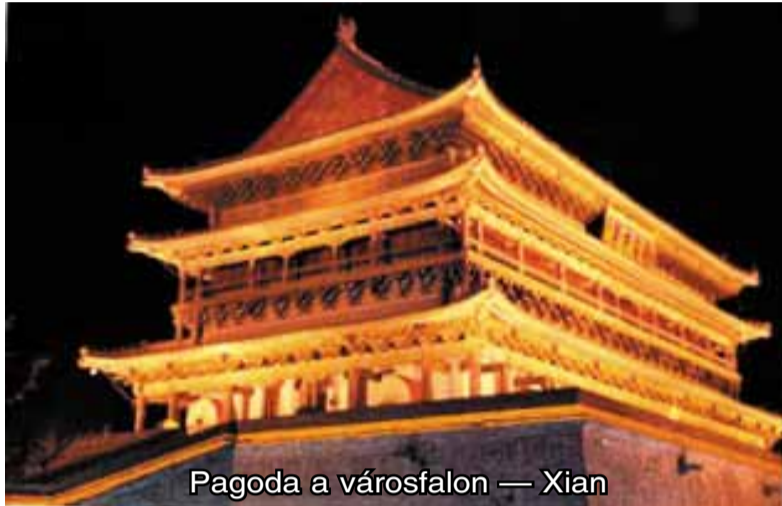
Pagoda a városfalon — Xian

galomra vannak beállítva. Az utca két oldalán a kis üzletek potom áron kínálják a 'márkás' árut, arany Rolex órákat, és a többi. Igyekeztünk a városka főterére eljutni, ahonnan egy kis golf kocsit vitt minket egy közeli kis faluba, megnézni hogy élnek a helyi parasztok. Csúnya hideg szél fújt át a kis nyitott kocsin, a rázós földes út