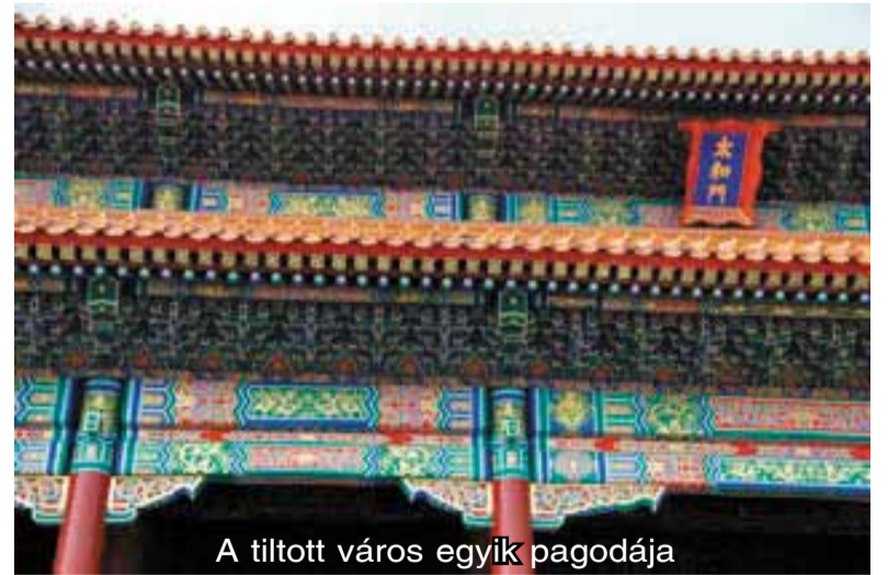
A tiltott város egyik pagodája

Útközben betértünk egy másik császári temetkezőhelyre, ami szintén több ezer éves. Ez a császár nem életnagyságú katonákkal temetkezett, mint Qin császár, hanem kis agyag katonákat tettek a sírjába, de míg a terrakotta hadsereg egyenruhái festve voltak, ezek a katonák és egyéb