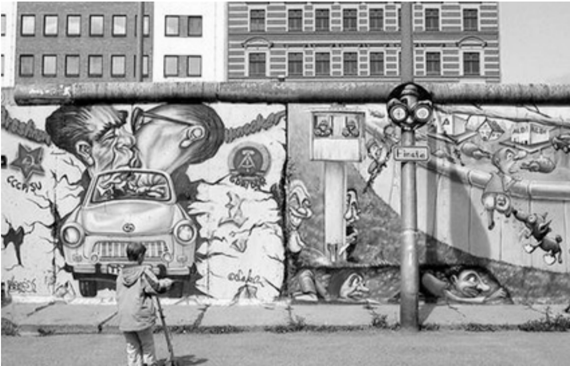
Graffiti a berlini falon

és a beruházó is azt közölte, hogy folytatódhatnak az egyeztetések.