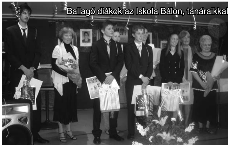
Ballagó diákok az Iskola Bálban, tanáraikkal