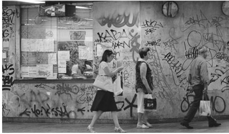
A falakon háborítatlanul hemzsegnek az értelmetlen tagek

Köszönhetjük még: Géza, Gusztáv, Oktávia, Oktávián, Szixtus, Ulrika, Ulrik nevű barátainkat.