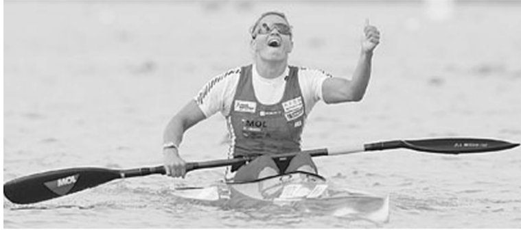
Kovács Katalin, akitől legalább egy olimpiai aranyat várnak a szurkolók