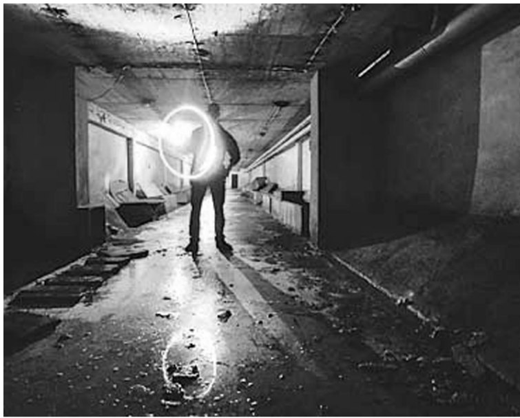
Az atombiztos objektum 1949 és 1953 között épült a 2-es metróval párhuzamosan

A DUNA TV vételéhez szükséges antenna felszerelésért hívja az AAA Com Satellite Systems díjmentes számát: Ausztráliában 1300 22 22 66 Új-Zélandon 0800 000 885