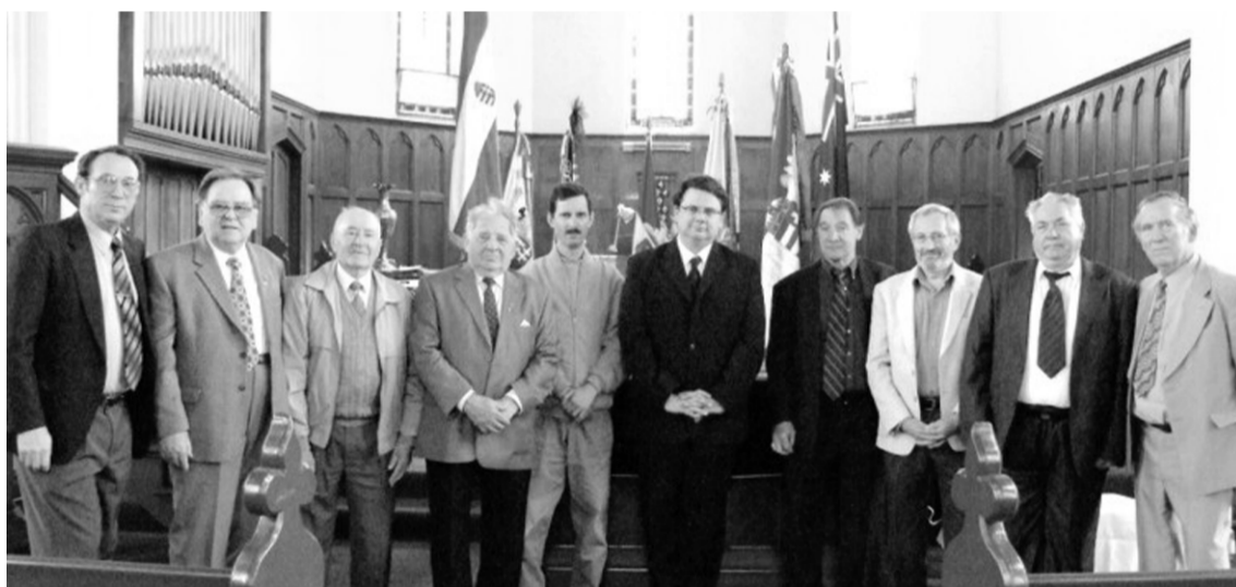
Presbitereink a szeptemberi gyűlésen