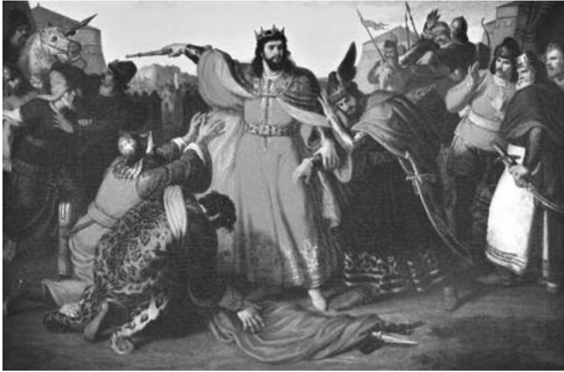
Than Mór festménye: Imre király András herceg táborában (1204)