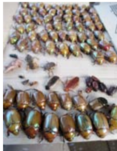
A zsákmány egy része

él erre felé. A tojást tojós, de kicsinyét mégis szoptató monotremák családjába tartozik ez a rendhagyó állat, melynek legközelebbi – és egyben egyetlen – rokona az erszényes sün. Kinézet szempontjából két különböző állatot szinte el sem lehetne képzelni, mert míg a kacsacsőrű, vízi állat lévén, síma szőrű, mondhatni „áramvonalas” küllemű, addig az erszényes sün kizárólag egy szárazföldi éllethez ikdomult, lomha mozgású, tüskés gombóc. S mégis, mindketten tojás formájában hozzák világra ivadékaikat és tejükön nevelik fel őket.