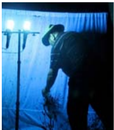
UV sátras gyűjtés

Ideje visszafordulnunk, irány Sydney ismét. Szaladnak az órák és napok, fogynak a km-ek. 6500 km, négy hét utazás és egy rövid Sydney-i pihenő után csapatunk a repülőtéren találja magát. Búcsúzunk, s reméljük, hogy expedíciónk eredménye, a több mint 10 000 preparált rovar hasznosnak bizonyul majd a magyar tudomány számára. Az, hogy pompás élményeket is mondhatunk magunkénak, az csak egy kis bónusz.