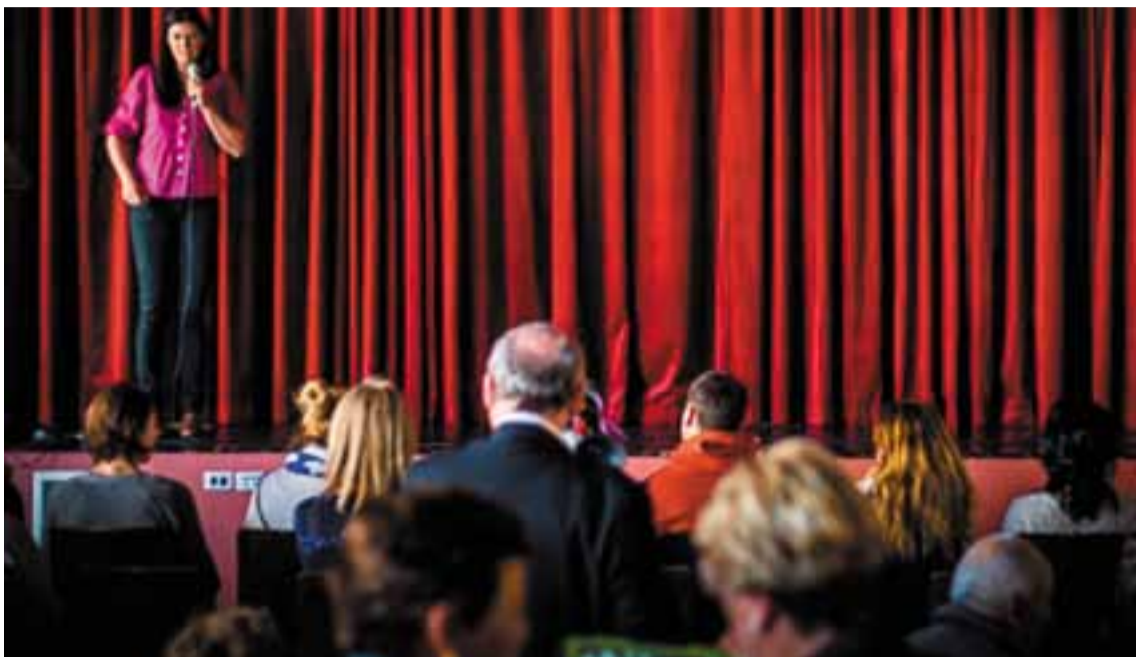
Márti megnyítja az anyák napi iskolai műsort