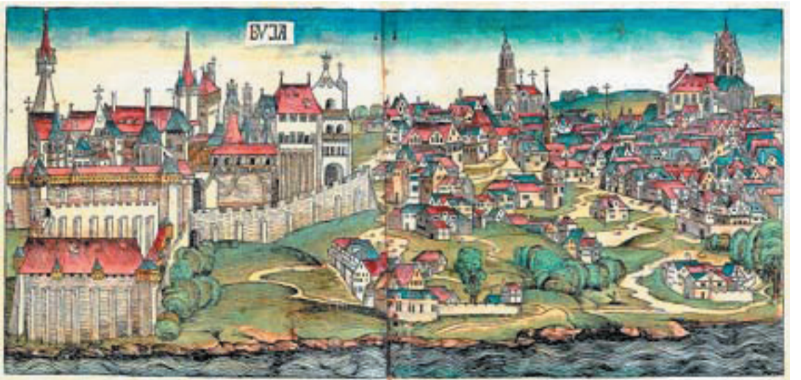
Buda látképe Schedel 1493-ban kiadott világkrónikájában

téve személyes ellentéteiket, és elnyomva az András származásával kapcsolatos kételyeket — egységesen kiálltak a herceg magyar királlyá koronázása mellett. Igaz, hogy valamilyen más és más célból kezdtek