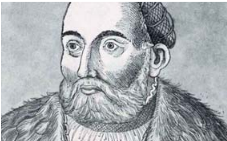
I. János magyar király arcképe. Erhard Schön (1491–1542) fametszete

Több információért vagy helyszin túsáért, kérem forduljon Simo Évához a (03) 8720 1300 telefonszámon www.ttha.org.au