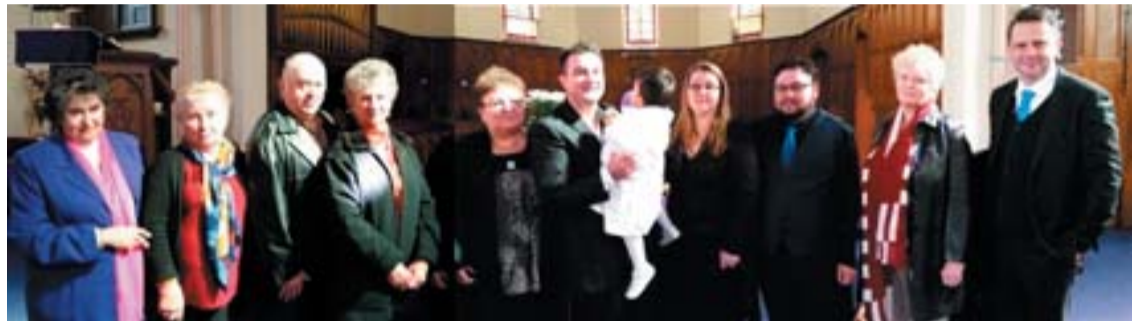
Keresztelő után az ünneplő család

Isten áldását kérjük mindannyiuk életére, hogy megtarthassák ünnepélyes fogadalmukat.