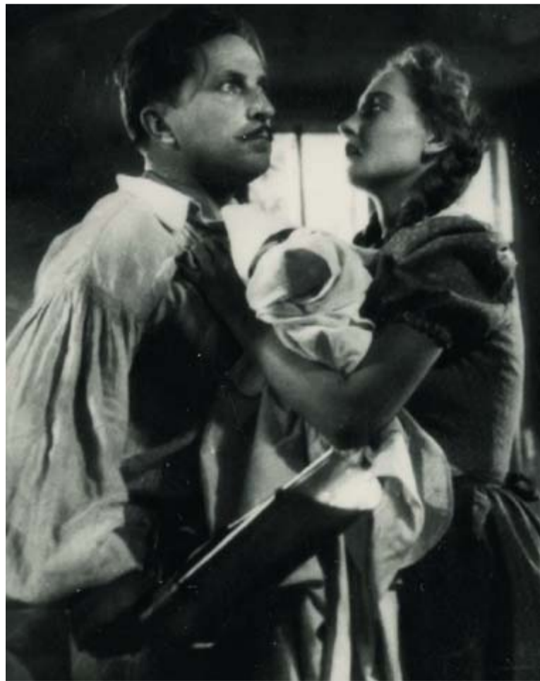
Páger Antal és Szellay Alice az Aranypáva című filmben, 1943