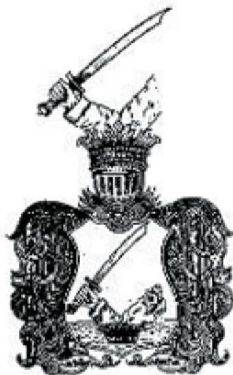
Az Arany család címere 1634-ből

Ki tudja, hogy a mai magyarság mennyire van átszőve azzal a „tudással”, amelyet a most kétszáz éves Arany János neve szimbolizál? Tudjuk, hogy a jelen idő mámorában élő