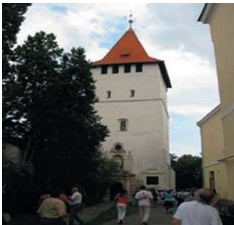
A Csonka torony