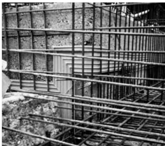
4. ábra Sika PVC fugaszalagok beépítése

Water absorption of concrete under pressure measures the maximum water penetration in mm after a defined time with a specified pressure (24 hours with 5 bar according MSZ EN 12390-8).