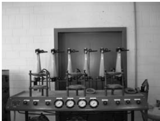
3. ábra Vízjáróság vizsgáló berendezés

Attól függően, hogy a vízzel szembeni védelem szintje milyen, azaz milyen a külső víznyomás, továbbá milyen a szerkezet tervezett hasznosítása: különböző kapcsolati és hézag-tömítési rendszerek léteznek. A nem mozgó hézagok általában olyan vízfelszívó szalagokkal tömíthetők, amelyek változatos keresztmetszetűek és vízzel érintkezve duzzadnak. A szalagokat gyakran felületi védelemmel látják el, hogy csökkentsék az idő előtti duzzadást, mint például ha bebetonozás előtt csapadék éri a szalagokat.