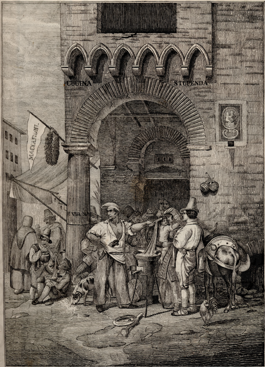
Maccaroni - árulók Nápolyban.