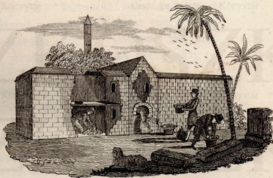
Egíptursi tojás - kemencze.