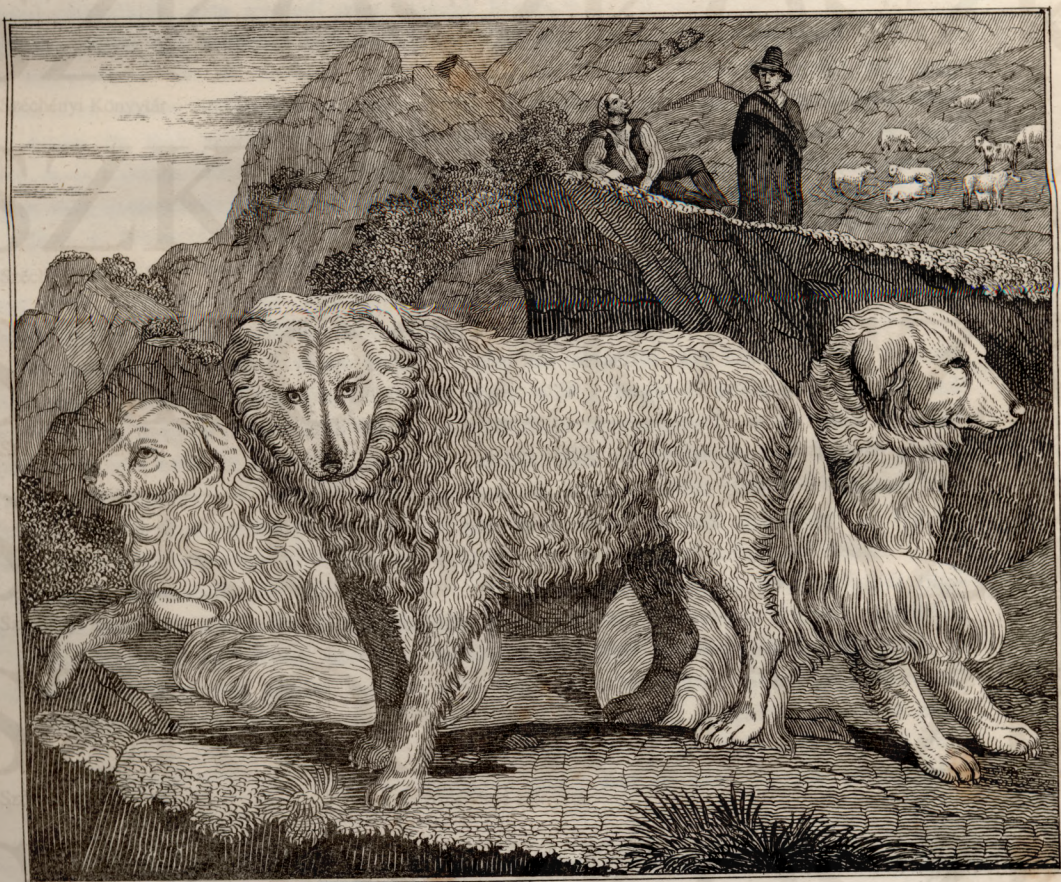
Komondor - kutyák az Abruzzi hegyekben.